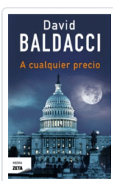
A CUALQUIER PRECIO BALDACCI, DAVID