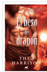
BESO DEL DRAGON, EL HARRISON