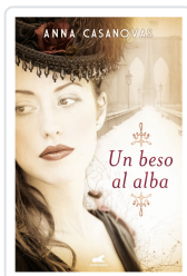
BESO AL ALBA, UN CASANOVAS, ANNA