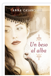
BESO AL ALBA, UN CASANOVAS, ANNA