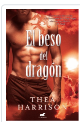
BESO DEL DRAGON, EL HARRISON