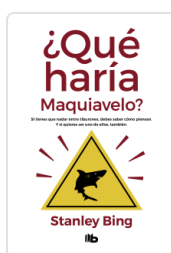
QUE HARIA MAQUIAVELO? BING, STANLEY