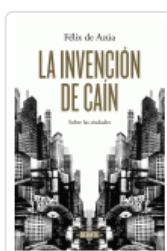
INVENCION DE CAIN, LA AZUA, FELIX DE