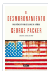
DESMORONAMIENTO, EL PACKER, GEORGE