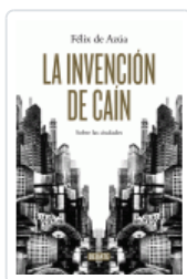
INVENCION DE CAIN, LA AZUA, FELIX DE