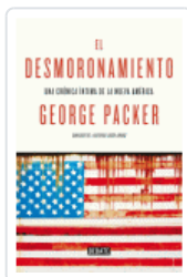
DESMORONAMIENTO, EL PACKER, GEORGE