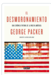
DESMORONAMIENTO, EL PACKER, GEORGE