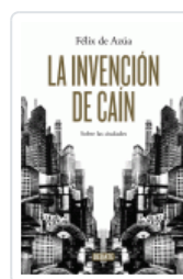
INVENCION DE CAIN, LA AZUA, FELIX DE