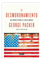
DESMORONAMIENTO, EL PACKER, GEORGE