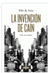
INVENCIÓN DE CAÍN, LA AZÚA, FELIX DE