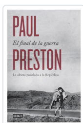
FINAL DE LA GUERRA, EL PRESTON, PAUL