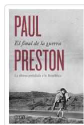
FINAL DE LA GUERRA, EL PRESTON, PAUL