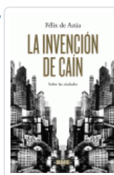
INVENCIÓN DE CAIN, LA AZUA, FELIX DE