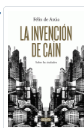
INVENCIÓN DE CAIN, LA AZUA, FELIX DE