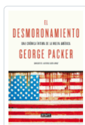
DESMORONAMIENTO, EL PACKER, GEORGE