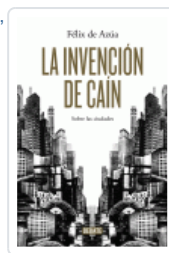
INVENCIÓN DE CAIN, LA AZUA, FELIX DE