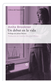
DEBUT EN LA VIDA, UN BROOKNER, ANITA