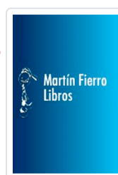
EXCEL 2003 MANUAL IMPRESINDIBLE