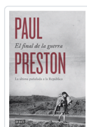
FINAL DE LA GUERRA, EL PRESTON, PAUL