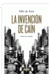
INVENCION DE CAIN, LA AZUA, FELIX DE