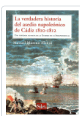
VERDADERA HISTORIA DEL ASEDIO NAPOLEONICO DE CADIZ 1810/1812 MORENO ALONSO, MANUEL