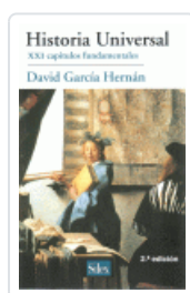
HISTORIA UNIVERSAL (2ª ED) GARCIA HERNAN, DAVID