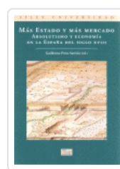
MAS ESTADO Y MAS MERCADO. ABSOLUTISMO Y ECONOMIA EN LA ... PÉREZ SARRION, GUILLERMO