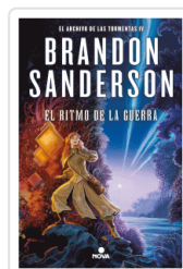
RITMO DE LA GUERRA, EL (ARCHIVO DE LAS TORMENTAS 4) SANDERSON, BRANDON