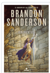
JURAMENTADA (EL ARCHIVO DE LAS TORMENTAS 3) SANDERSON BRANDON