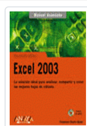
EXCEL 2003 MANUAL AVANZADO CHARTE, FRANCISCO