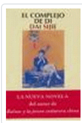
COMPLEJO DE DI SIJIE, DAI