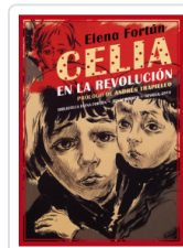
CELIA EN LA REVOLUCION FORTUN, ELENA