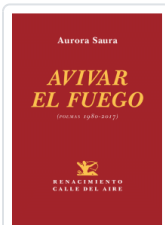
AVIVAR EL FUEGO SAURA, AURORA