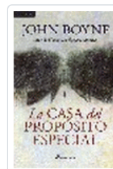
CASA DEL PROPOSITO ESPECIAL BOYNE