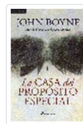
CASA DEL PROPOSITO ESPECIAL BOYNE