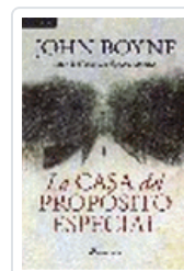
CASA DEL PROPOSITO ESPECIAL BOYNE