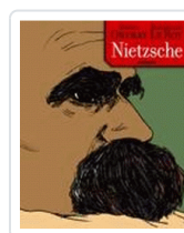
NIETZSCHE LE ROY, MAXIMILIEN / ONFRAY, MICHEL / LE