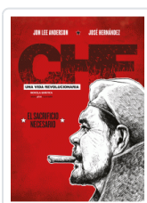
CHE. UNA VIDA REVOLUCIONARIA ANDERSON, JON LEE