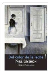
DEL COLOR DE LA LECHE LEYSHON, NELL