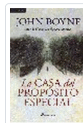
CASA DEL PROPOSITO ESPECIAL BOYNE