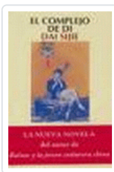
COMPLEJO DE DI SIJIE, DAI