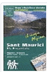
SANT MAURICI ELS ENCANTATS ES000084ALPINA