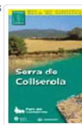
SERRA DE COLLSEROLA