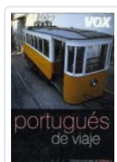
PORTUGUES DE VIAJE