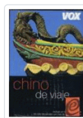
CHINO DE VIAJE