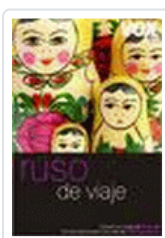
RUSO DE VIAJE