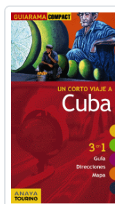
CUBA GUIARAMA URUEDA, ISABEL