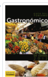
GUIA DEL TURISMO GASTRONOMICO EN ESPAÑA (2012) AAVV