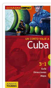
CUBA GUIARAMA URUEÑA, ISABEL