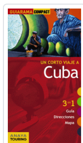
CUBA GUIARAMA URUEDA, ISABEL