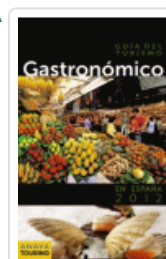
GUIA DEL TURISMO GASTRONOMICO EN ESPAÑA (2012) AAVV