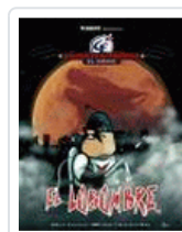
LOBOMBRE. CALICO ELECTRONICO. EL COMIX NIKODEMO