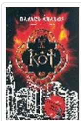
KOT ABALOS, RAFAEL