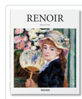
RENOIR (ESP) AA.VV