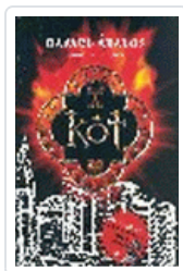
KOT ABALOS, RAFAEL