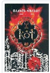
KOT ABALOS, RAFAEL