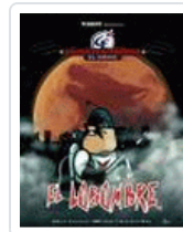
LOBOMBRE. CALICO ELECTRONICO. EL COMIC NIKODEMO