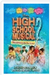
HIGH SCHOOL MUSICAL 2. ¡PREPARATE PARA LA FIESTA!