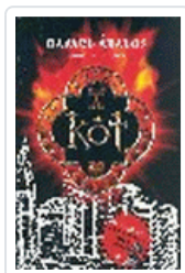
KOT ABALOS, RAFAEL