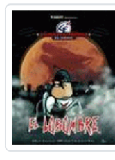
LOBOMBRE. CALICO ELECTRONICO. EL COMIX NIKODEMO