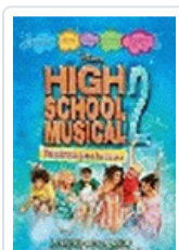
HIGH SCHOOL MUSICAL 2. ¡PREPARATE PARA LA FIESTA!