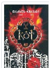
KOT ABALOS, RAFAEL