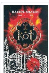
KOT ABALOS, RAFAEL