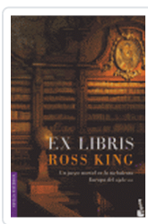
EX LIBRIS ROSS KING