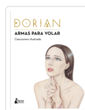
ARMAS PARA VOLAR DORIAN