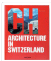
ARCHITECTURE IN SWITZERLAND (ING) JODIDIO, PHILIP