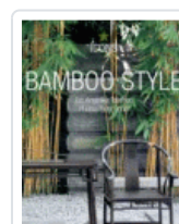
BAMBOO STYLE (ICONS)