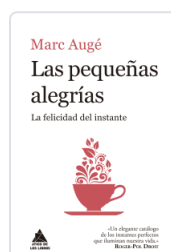
PEQUEÑAS ALEGRÍAS LAS AUGE, MARC