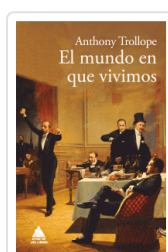
MUNDO EN QUE VIVIMOS EL TROLLOPE, ANTHONY