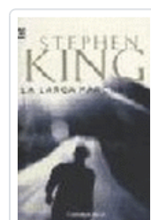
LARGA MARCHA, LA 102/19 KING, STEPHEN