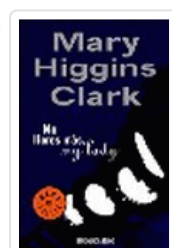
NO LLORES MAS MI LADY HIGGINS, CLARK