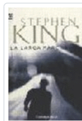
LARGA MARCHA, LA 102/19 KING, STEPHEN