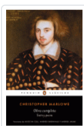
OBRA COMPLETA. TEATRO Y POESIA (MARLOWE) MARLOWE, CHRISTOPHER