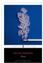
POESIA (GONGORA) GONGORA, LUIS DE