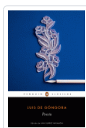
POESIA (GONGORA) GONGORA, LUIS DE