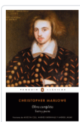
OBRA COMPLETA. TEATRO Y POESIA (MARLOWE) MARLOWE, CHRISTOPHER