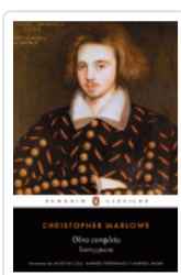
OBRA COMPLETA. TEATRO Y POESIA (MARLOWE) MARLOWE, CHRISTOPHER