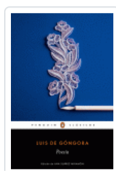
POESIA (GONGORA) GONGORA, LUIS DE