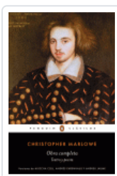
OBRA COMPLETA. TEATRO Y POESIA (MARLOWE) MARLOWE, CHRISTOPHER