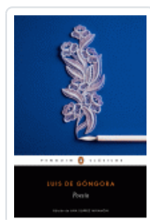
POESIA (GONGORA) GONGORA, LUIS DE